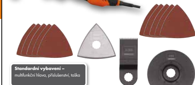
Standardní vybavení – multifunkční hlava, příslušenství, taška