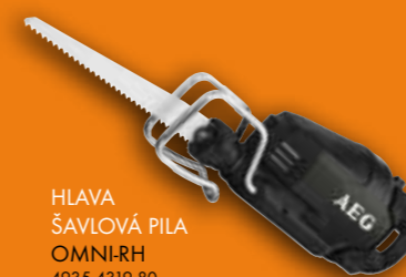
HLAVA ŠAVLOVÁ PILA OMNI-IH 4935 4319 80