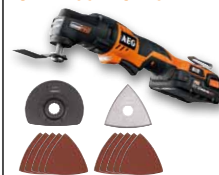
Typ: OMNI 18C LI-152B SET1 Obj. číslo: 4935 4406 44