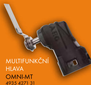
MULTIFUNKČNÍ HLAVA OMNI-MT 4935 4271 31

OMNI PRO je revoluční systém, který umožní uživatelům přizpůsobit svůj systém k aplikaci. Všechny hlavy a základní jednotky jsou vzájemně zaměnitelné, nejlepší poměr výkonu základny a hlavy pro maximální produktivitu.