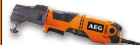
Typ: OMNI-300 SET1 Obj. číslo: 4935 4317 90